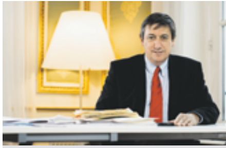
JAN JAMBON La sécurité... c'est l'affaire de tous